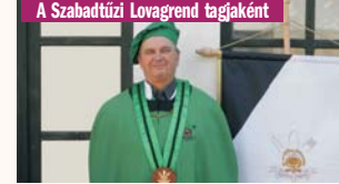
A Szabadkúzi Lovagrend tagjaként

versényeit. Hagományos tápióvidéki ételek receptjeit gyűjtötte könyvbe, rendezte azokat „Aranyszarvas földjén” címmel. A szomszéd településeken indította el pl. a pándi meggy-fesztivált, a tápióbsckei rétesversenyt. Nagy része volt az országos hírvé szentmártoni hurokoltó fesztivál kitalálásában is.