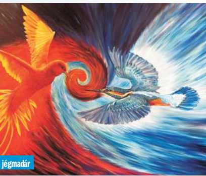
Tűzmadár és jégmadár

Miért veszélyes az, ha leszoktunk a valódi katartikus élményt jelentő alkotások élvezetéről? Azért, mert a magas szintű esztétika képes arra, hogy a külvilágból jövő bőséges negatív ingereket semlegesítse. Elovasztja a félelmeket, fájdalmakat, negatív érzelmi töltéseket és nem kelti azokat! Mindenkinél azt „kezelem”, amire éppen szüksége van. De erre csak a valódi esztétika képes, a hamis, ráfogott esztétika nem és az sem, ha az alkotó rossz mentális és érzelmi állapotban van, mert az rányomja a Te hangulatodra is a bélyeget, ha a nap 24 órájában nézed.