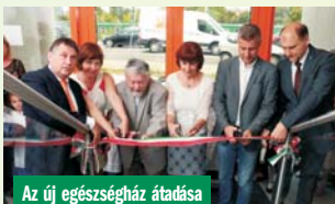
Az új egészségház átadása

Úgyszintén, az idős kerületi lakosok orvoshoz, illetve a Flór Ferenc Kórházba szállítását a kezelésekre, majd hazaszállításukat is végzik - ezt is ingyenesen! Kerületi kerékpár út hálózatot adtak át, a hozzá kapcsolódó sport és szabadidő parkokkal - éjszakai napleemes világtással!