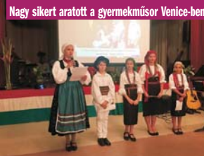
Nagy sikert aratott a gyermekműsor Venice-ben

Világklub Sarasotai Társklubjának elnöke köszöntötték a jelenlévőket. Elhangzott, hogy Wass Albert innen pár száz kilométerre, Astor városában töltötte életének nagy részét, közel fél évszázadot, s több alkalommal is megfordult, itt, a Magyar Házban.