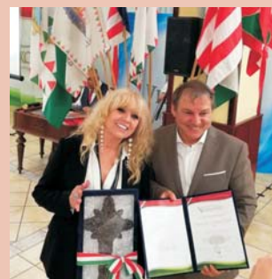
Hazádnak rendületlenül... a Szózat közös éneklésével kezdődött május 14-én a