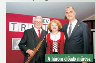
A három előadó művész

Egyesület elnöke, a Brisbane-i Magyar Szín-társulat oszlopos tagja, aki tíz éven át a ma-