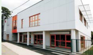
Az új cinkotai egészségház

Megújult játszótérek, parkok, több mint 300 leaszfaltozott út, emlékművek, új uszodák, HÉV állomáshoz kiépített parkoló, új piac Sashalmon, új Községi terem, új és felújított óvodák - több helyen kiépített (ingyenes!) elektromos autótöltők, a Reformátorok terén felépített Kilitó, - továbbá bevezették a Nyugdíjasok Segítő- és Szállító Szolgálatát, ahol a kerületi nyugdíjasokat mikrobusszal elviszik egy bevásárlóközpontba, vagy a Sashalmi piacra bevásárolni - majd hazaviszik őket - ingyenesen!