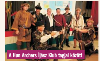
A Hun Archers Íjász Klub tagjai között