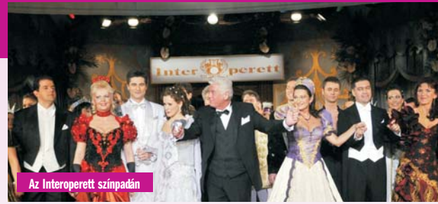
Az Interoperett színpadán