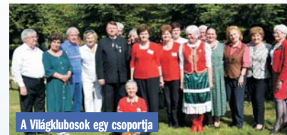
A Világklubosok egy csoportja