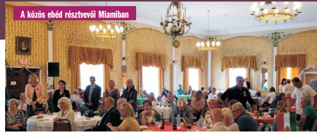
A közös ebéd résztvevői Miami-ban