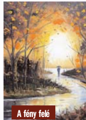
A fény felé

– Tájképeimet realista stílusban, olaj technikával készítem. De az utóbbi időben szívesen festek késsel is, impresszionista stílusú képeket.