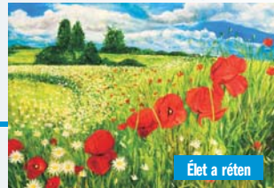
Élet a réten

A festőművész weboldala és elérhetőségei: https://gerendaspaula.com/portfolio