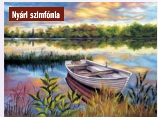
Fény és árnyék

– Nyugdíjazásomat követően időmilliomos lettem, ezért feleléd bennem a régi vágy, a fiatal kori szerelem, és az alkotás, a festés megint főszerepet kapott az életemben – mondja – s majd 48 év kihagyás után, 2014-ben újra kezembe vettem az ecsetet. Utazásaim során gyönyörű tájakon jártam, melyeket fotóimmal örökítettem meg, és ezek a fotók később festmény formájában láttak napvilágot. A természet szépsége mindig lenyűgözött, ezért is lett a festményeim kedvenc témája a táj változatossága, gyönyörűsége.