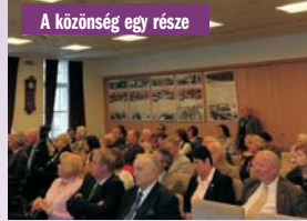
A közönség egy része