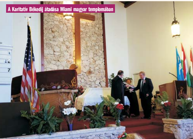
A Karitatív Békédíj átadása Miami magyar templomában