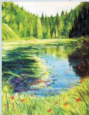
A lélek tükré

Erre hamar felkaptam a fejemet, mert számomra egyértelmű, hogy mi a jó és mi a rossz, és az is evidens, hogy ezt bárki meg tudja csinálni. Elkezdtem megvizsgálni ezt a jelenséget, és a következőkre jutottam, és amit most mondok, nemcsak az én véleményemet tükrözi, hanem a közönségét is.