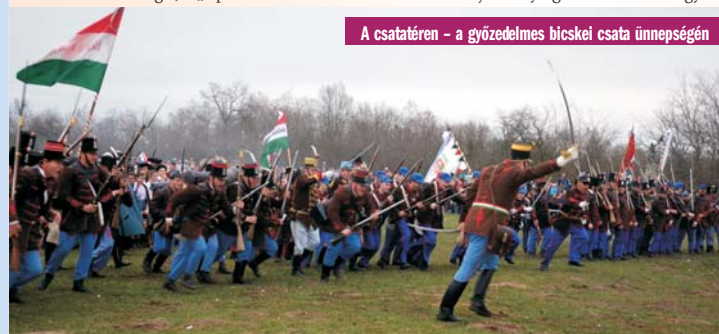
A csataterén - a győzelmes bicsei csata ünnepségén

tésével vitték Gyergyószentmiklósról adományt az ezeréves határra a megépült kápolnához. Most ugyanígy kápolnát épít az 1849-ben elesettek emlékére a tápióbsckei harcmezőn.